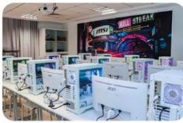
Labo Virtual Reality