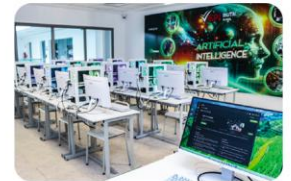
Labo Intelligence Artificielle