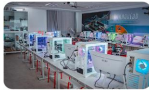
Labo Internet of Things