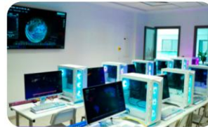
Labo Cyber Sécurité