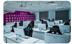
Centre de certifications